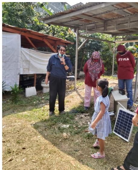
Gambar 4. Penjelasan tentang PLTS