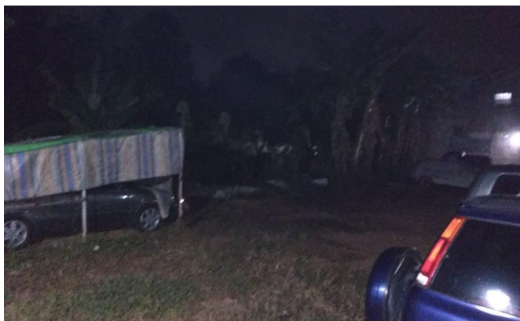
Gambar 1. Kondisi yang akan di pasang PLTS

Pada kehidupan sekarang ini bahwa teknologi semakin cepat berkembang, kebutuhan akan listrik pun juga semakin banyak, PLTS sudah menjadi barang umum di masyarakat, namun barang dan bentukannya masih dirasa mahal karna tidak dan belum ada di setiap daerah ada penjualnya masih kategori produk langka dan mahal. Oleh sebab itu situasi dan kondisi di tempat atau area pengabdian ini di jalankan merupakan area umum, dimana penerangan cahaya malam terlihat kurang atau masih gelap.