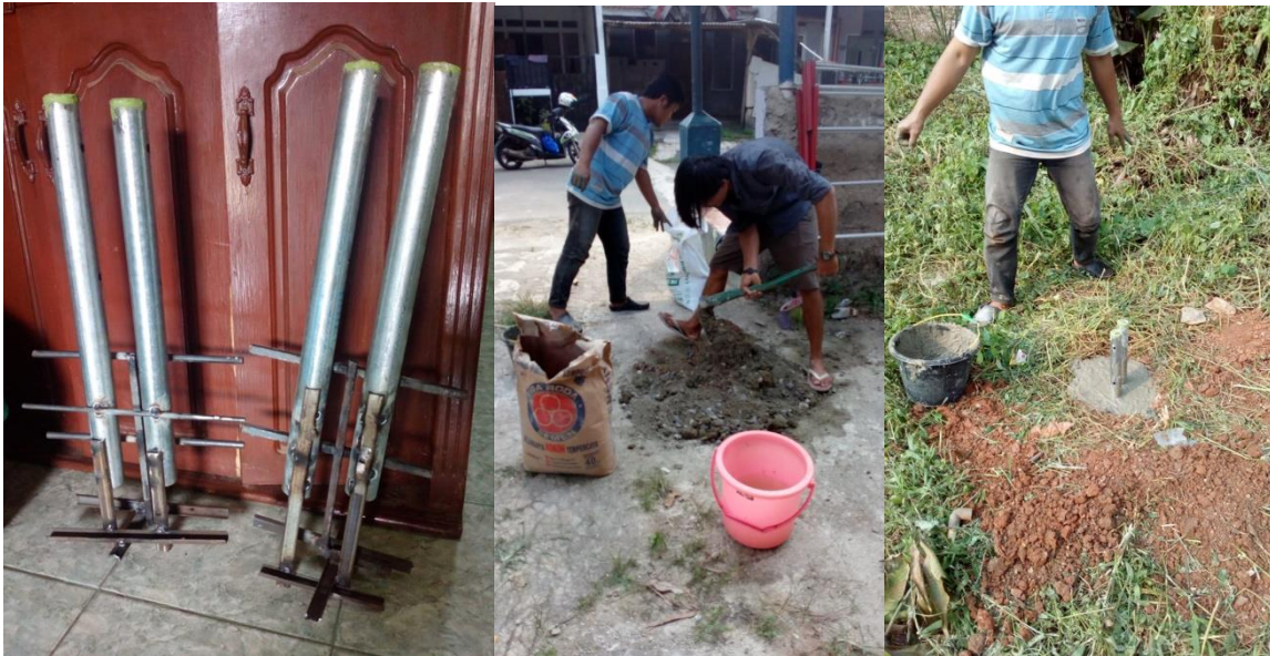
Gambar 5. Pemasangan Pondasi untuk Tiang Lampu PLTS

Untuk penjelasan itu setiap bahasan apa yang kita sampaikan boleh dengan langsung ditanyakan apa yang menjadi pertanyaan dan penasaran dari masyarakat. Karena hal itu untuk langsung lebih cepat dan mendalami sistemnya. Dalam konsep pemaparan dan sosialisasinya itu kami menggunakan metode pendekatan yang santai dan bersahaja (tidak formil dalam ruangan / aula) namun langsung di area yang di pasang implementasinya PLTS nya.