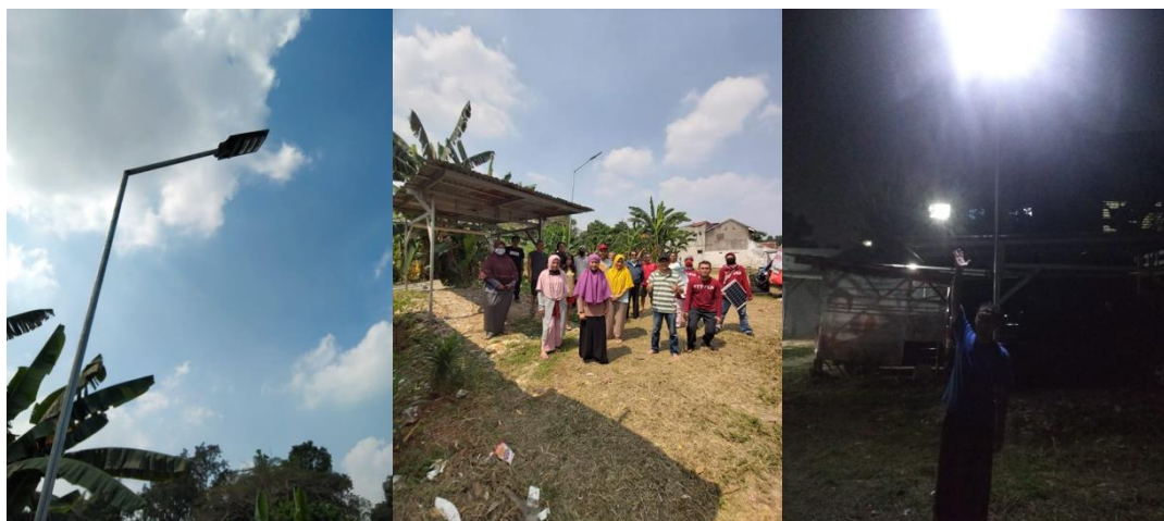
Gambar 6. Hasil memasang PLTS bersama warga sekitar

Setelah pemasangan pondasi tidak langsung serta merta dalam satu hari itu di pasang tiang penyangga PLTS nya, namun minimal di tunggu beberapa hari biar kuat dan kokoh benar benar kering untuk semen dan pondasi bawahnya.