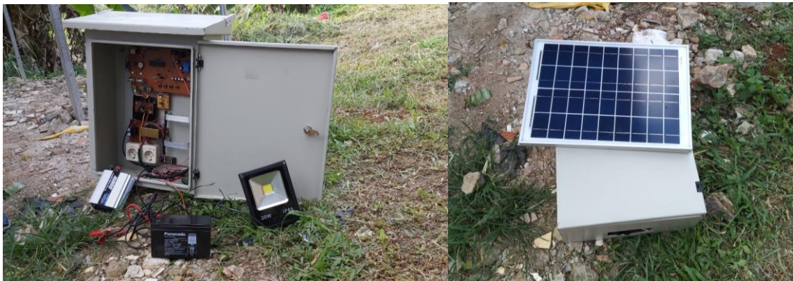
Gambar 3. Komponen dan bagian dari PLTS

Dalam sosialisasi itu masyarakat cukup antusias dalam mengulik dan penasaran dalam teknologinya dimana mereka banyak yang belum mengenal dan mengerti kenapa bisa sinar matahari itu bisa menghasilkan energi listrik. Nah disitulah peran besar kita sebagai dosen maupun perantara dalam dunia teknologi ini sangat dibutuhkan dan membantu masyarakat sekitar.