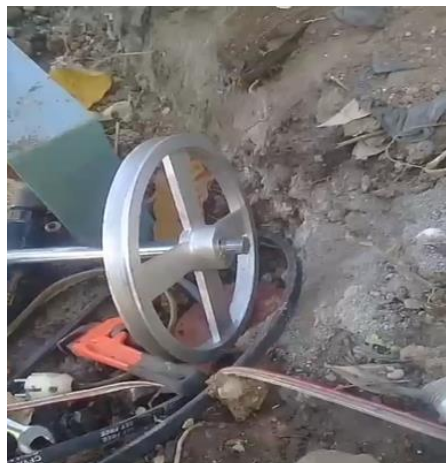
Gambar 12. Merakit pully