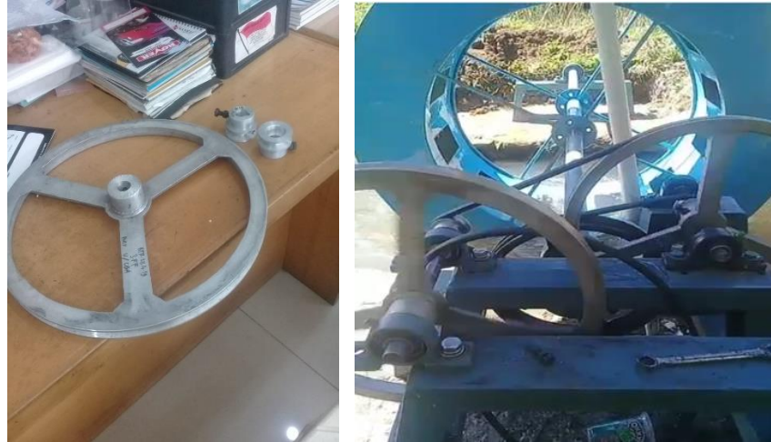
Gambar 10. Merakit kincir air dan pully