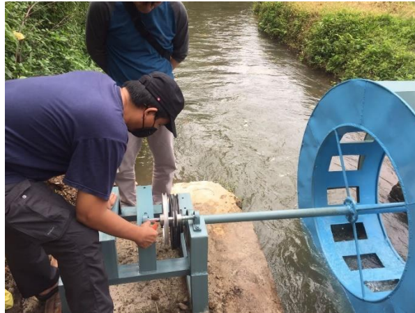
Gambar 13. Pengukuran putaran pully (rpm)

Pada Gambar 13 dilakukan pengukuran rpm menggunakan tachometer untuk mengetahui kecepatan rpm putaran kincir air dan pully yang telah dipasang karena hal tersebut akan mempengaruhi kecepatan putar generator dan daya output generator.