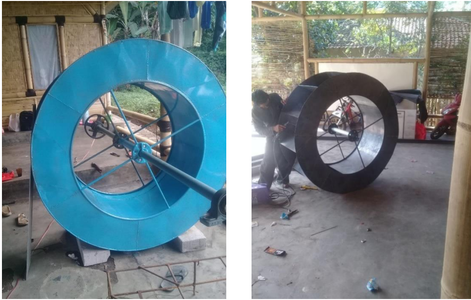
Gambar 4. Pembuatan kincir air