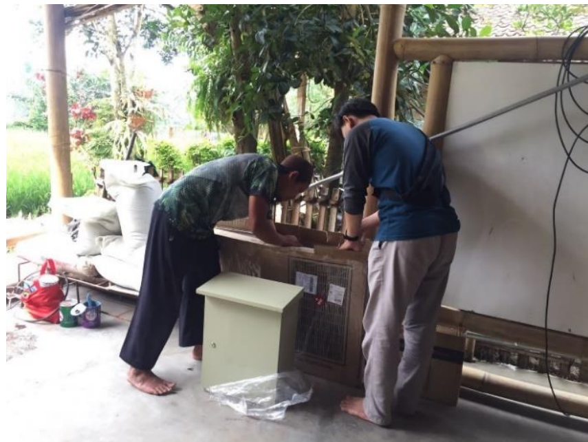
Gambar 7. Identifikasi komponen