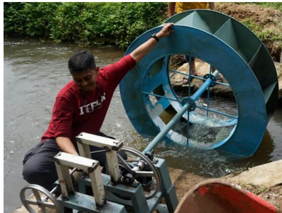
Gambar 11. Memastikan kincir air dan pully berjalan dengan baik