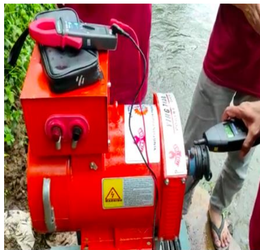
Gambar 14. Pengukuran putaran generator (rpm)

Pada Gambar 13 dilakukan pengukuran rpm menggunakan tachometer untuk mengetahui kecepatan rpm putaran kincir air dan pully yang telah dipasang karena hal tersebut akan mempengaruhi kecepatan putar generator dan daya output generator.