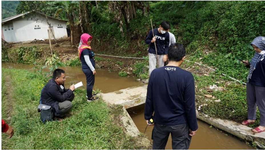
Gambar 1. Tim PKM Melakukan Survei Lokasi Pemasangan PLTMH

daerah ini dekat dengan aliran yang mempunyai ketersediaan air yang cukup dan dapat digunakan sepanjang tahun serta mempunyai debit yang dapat diandalkan. Pemanfaatannya sebagai PLTMH diharapkan dapat membantu masyarakat sekitar untuk meningkatkan keadaan ekonomi dan memenuhi kebutuhan konsumsi listrik di daerah tersebut. Kebutuhan energi listrik yang dibutuhkan adalah sekitar 2 kW yang digunakan untuk penerangan rumah dan penerangan jalan umum (PJU).