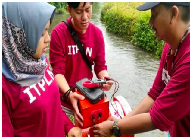
Gambar 15. Pengukuran tegangan dan arus generator (rpm)