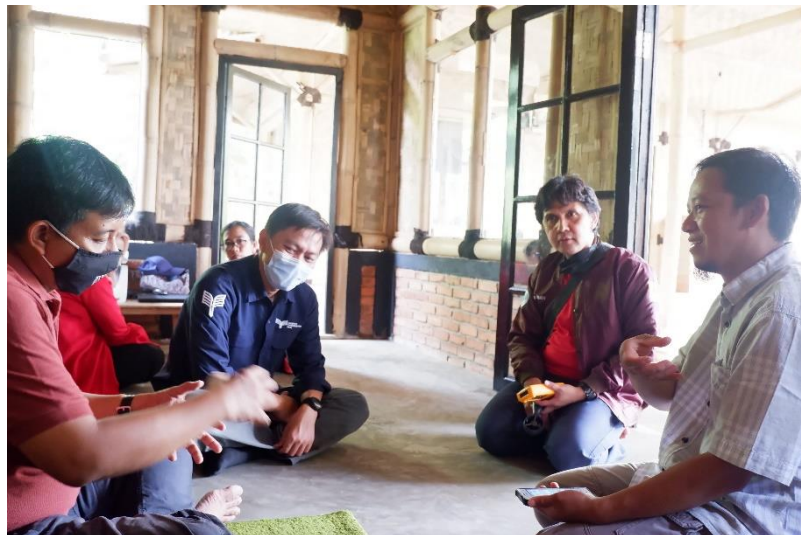
Gambar 2. Tim PKM Melakukan Diskusi untuk Perancangan

Survey potensi air sebagai dasar dalam perencanaan dan pembangunan Pembangkit Listrik Tenaga Mikro Hidro (PLTMH) ini dilakukan dalam tiga tahapan metode seperti dibawah ini: