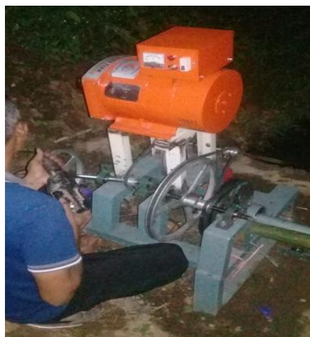
Gambar 9. Merakit generator danudukan generator

Setelah proses pemasanganudukan maka dilanjutkan dengan melakukan proses perakitan generator, pully dan kincir air yaitu menyusun dan menyatukan berbagai komponen yang telah ditentukan sesuai dengan rancangan yang telah dibuat pada awal penelitian. Persiapan perakitan Pembangkit Listrik Tenaga Mikro Hydro dilakukan di Kp. Gadog, Ds, Sukamahi, Kab, Cianjur. Perakitan diawali dengan perakitan generator denganudukan generator. Hal tersebut dilakukan untuk memastikan agar generator dapat terpasang secara sempurna sehingga ketika PLTMH bekerja, generator dapat dipastikan tidak bergeser ataupun bergerak. Selanjutnya dilakukan perakitan kincir air dengan shaftnya, sehingga dapat dipastikan kincir air berada di tengah-tengah shaftnya dalam keadaan seimbang dan dapat berputar secara sempurna. Kemudian dilakukan perakitan pully dengan kincir air. Dalam hal ini, akan dihitung jumlah pully yang dibutuhkan karena jumlah pully berhubungan dengan jumlah putaran yang dihasilkan oleh kincir air dan besarnya daya yang dapat dibangkitkan oleh generator listrik.