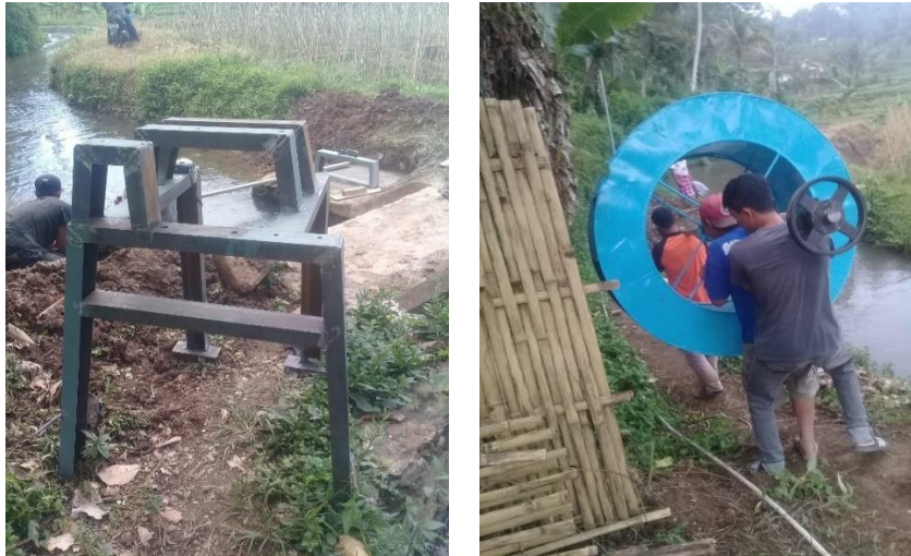
Gambar 8. Pemasanganudukan generator 3 kW dan kincir air

Setelah proses pemasanganudukan maka dilanjutkan dengan melakukan proses perakitan generator, pully dan kincir air yaitu menyusun dan menyatukan berbagai komponen yang telah ditentukan sesuai dengan rancangan yang telah dibuat pada awal penelitian. Persiapan perakitan Pembangkit Listrik Tenaga Mikro Hydro dilakukan di Kp. Gadog, Ds, Sukamahi, Kab, Cianjur. Perakitan diawali dengan perakitan generator denganudukan generator. Hal tersebut dilakukan untuk memastikan agar generator dapat terpasang secara sempurna sehingga ketika PLTMH bekerja, generator dapat dipastikan tidak bergeser ataupun bergerak. Selanjutnya dilakukan perakitan kincir air dengan shaftnya, sehingga dapat dipastikan kincir air berada di tengah-tengah shaftnya dalam keadaan seimbang dan dapat berputar secara sempurna. Kemudian dilakukan perakitan pully dengan kincir air. Dalam hal ini, akan dihitung jumlah pully yang dibutuhkan karena jumlah pully berhubungan dengan jumlah putaran yang dihasilkan oleh kincir air dan besarnya daya yang dapat dibangkitkan oleh generator listrik.