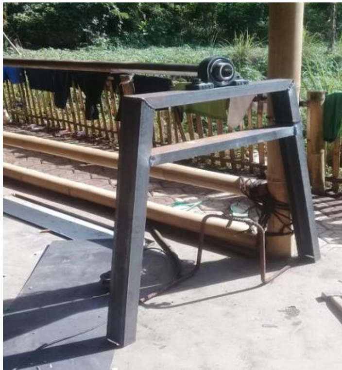
Gambar 5. Pembuatan dudukan kincir air